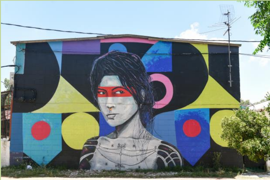
9. Artista: Juan Vidal