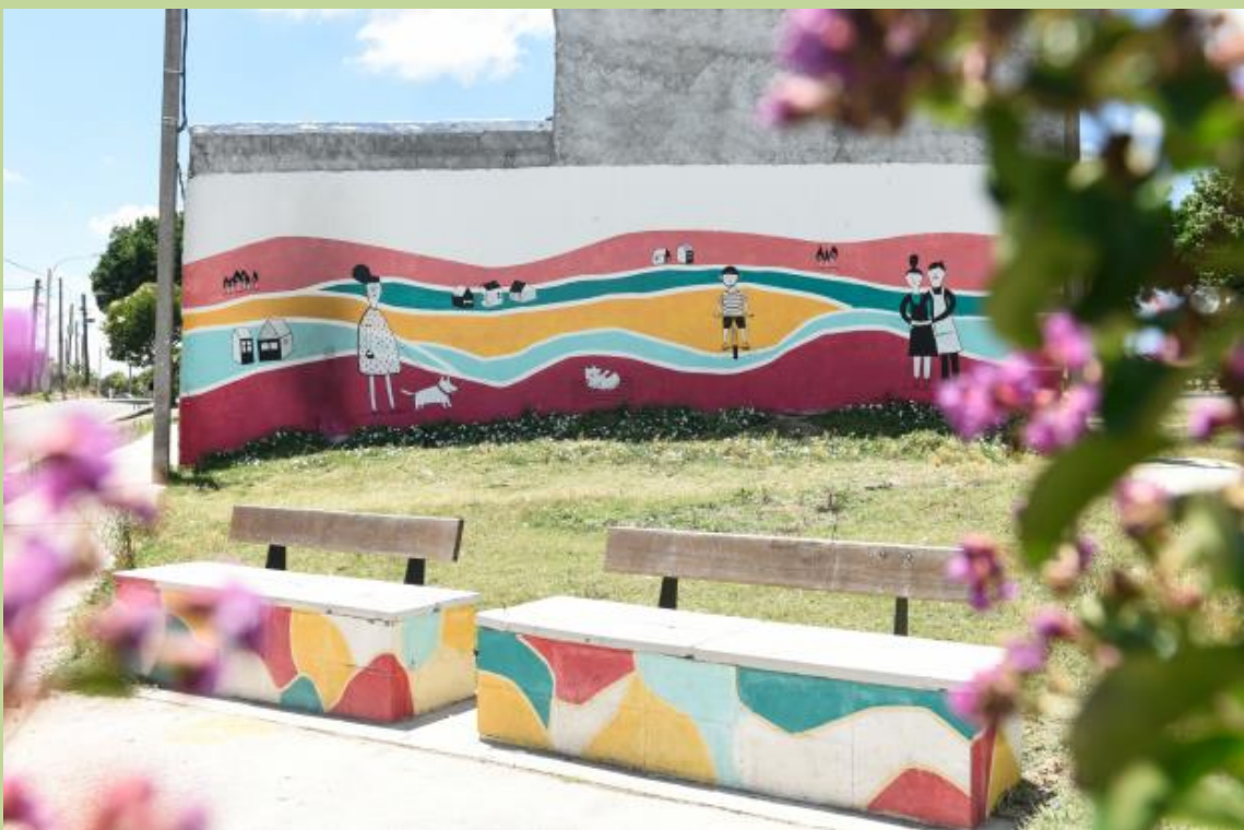
6. Artista: equipo organización Grameen-Uruguay