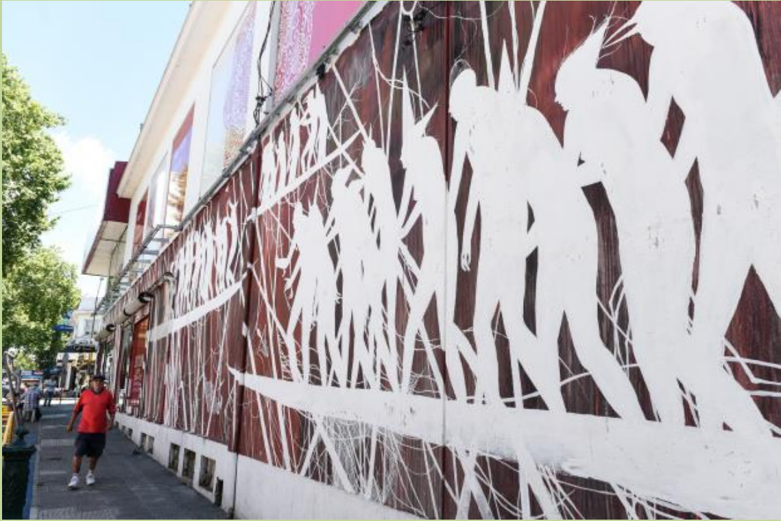
3. Artista: David de la Mano