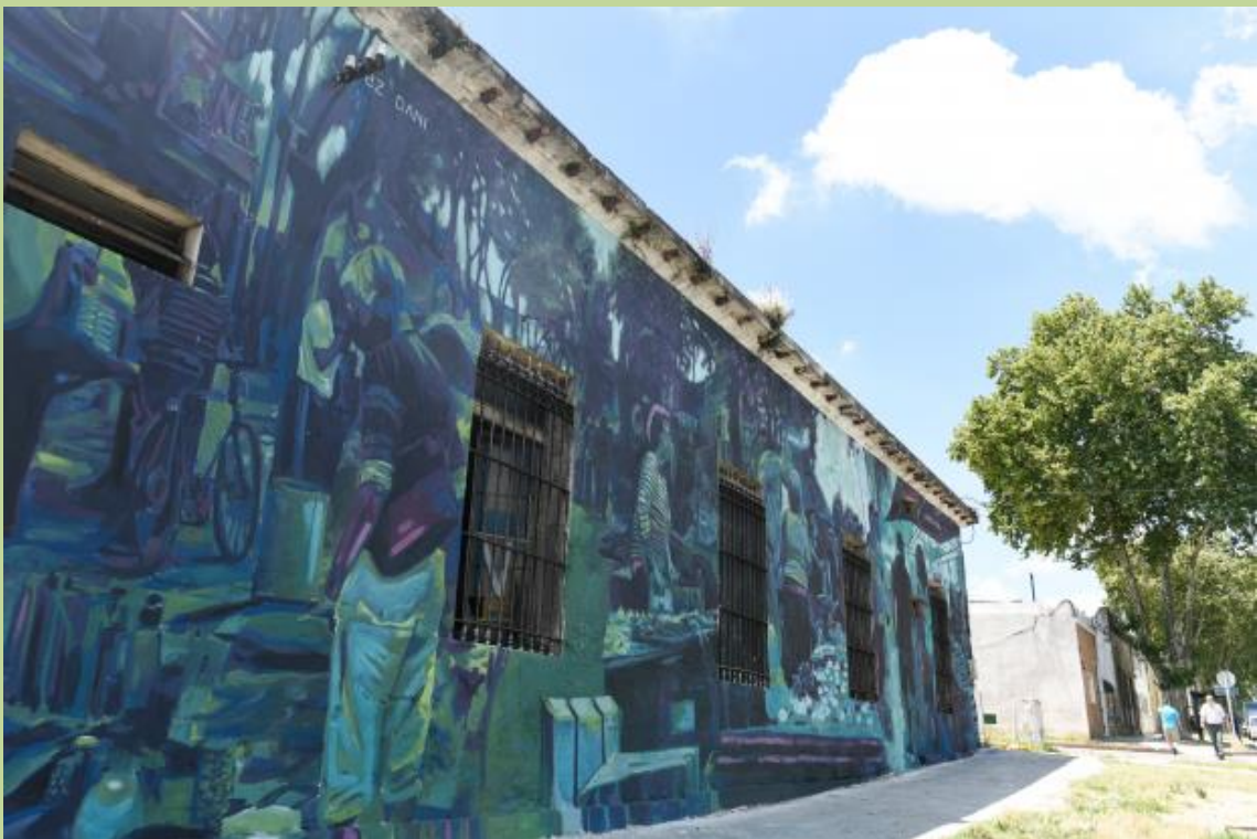
4. Artista: Daniel Freitas/Pezdani