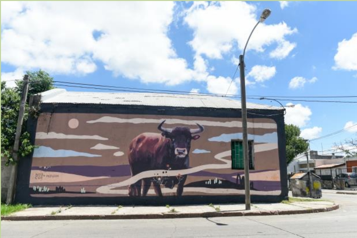
7. Artista: Daniel Freitas/Pezdani